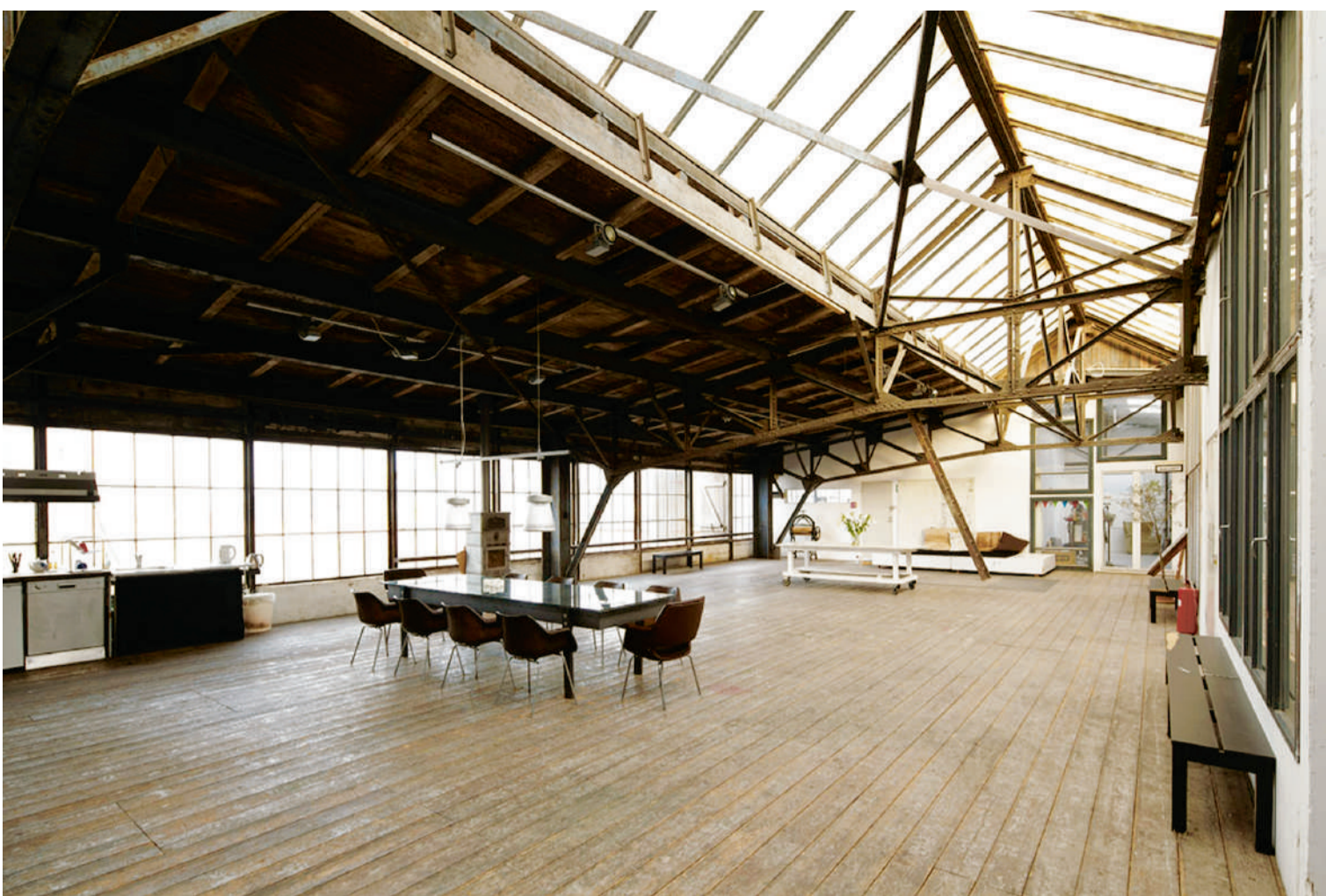
Skabelonloftet på Refshaleøen i København.