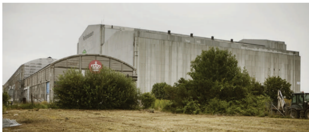
B&amp;Ws gamle samlehal, hvor den kreative klasse er rykket ind.

Den gule administrationsbygning forekommer noget usælselig ovenfra fra Langeliniekajen, men »det er det mest fotograferede hus i Danmark, selv om de færreste kender det. Det skyldes, at det altid kommer med, når man fotograferer Den lille havfrue fra Langeliniesiden,« fortæller Herskind, hvis opgave er at sørge for, at dette terrains vague lever og har det godt, indtil byudviklingen skydes i gang. Han gøder jorden, så at sige, og udvikler også metoder til, hvordan man kan administrere store, urbane områder i en venetid, så de optimeres, og lokalplanerne kan vedtages på bedst tænkeligt grundlag, når der skal bygges boligkvarterer. »Det handler om at skabe liv. Det sker bedst, hvis man inviterer kulturelle iværksættere, fortrinsvis ledere inden for deres felt, til at arbejde her. De har nu i et stort antal færdige atelierer, tegnestuer og kontorer på Refshaleøen, og da de fungerer som forbilleder, trækker de yderligere kreative iværksættere til. Men kunstnerne gider ikke kun være sammen med andre kunstnere. De vil gerne have, at der for eksempel også er autoværksteder, tomrøre, smedeværksteder, husbåde og småfabrikker, der producerer forskellige ting.